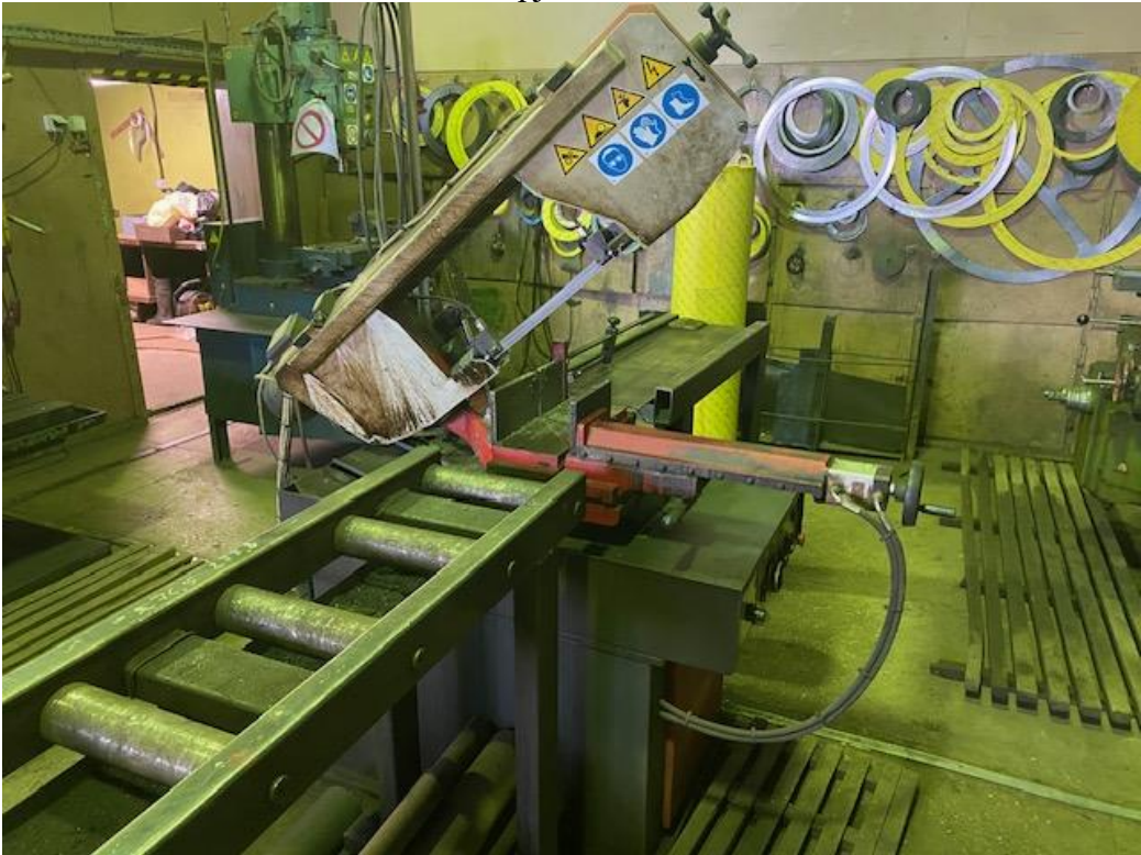
Inventorinis Nr.310467 Juostinio pjovimo staklės Miva 300SI 3F