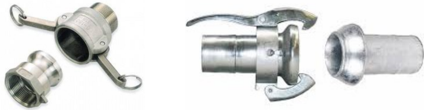
2 pav. Guminių žarnų jungčių pavyzdžiai

16. Naudojant gumines žarnas jos negali būti perlenktos, sulenkimo kampas negali viršyti gamintojo nustatyto minimalaus sulenkimo spindulio, nes galima žarnos sienelių deformacija. Draudžiama gumines žarnas dėti ant aštrių briaunų, karštų paviršių, elektros kabelių.