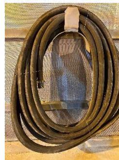
1 pav. Guminių žarnų saugojimui skirtų įrenginių pavyzdžiai

11. Saugojimo vietoje guminės žarnos turi būti apsaugotos nuo sąlyčio su daiktais, dėl kurių gali atsirasti įpjovimų, įbrėžimų ar įtrūkimų bei nuo sąlyčio su cheminėmis medžiagomis, tokiomis kaip tirpikliai, kuras, alyva, riebalai arba lengvai garuojančios medžiagos.