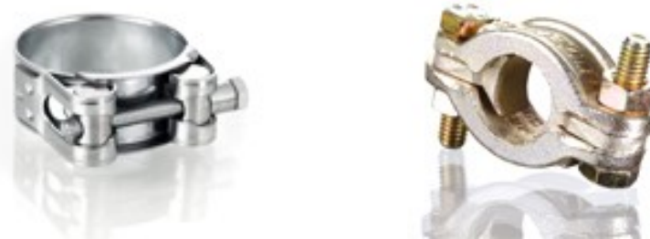
3 pav. Guminių žarnų fiksavimui ant jungčių skirtų metalinių apkabų pavyzdžiai

17. Draudžiama naudoti gumines žarnas, jei ant jų yra matomi defektai (nusitrynusios vietos, įpjovimai, išsipūtusios vietos, negrįžtamoji deformacija), ar pasibaigė jų eksploatavimo terminas.