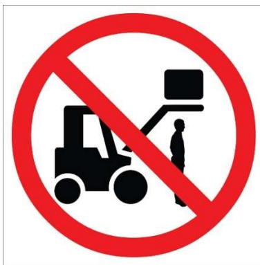
1 pav. Ženklas „Draudžiama būti po šakėmis!“

10. Krautuvai, kurių kėlimo aukštis daugiau kaip 2000 mm, turi būti paženklinti ženklu „Draudžiama būti po šakėmis!“ (1 pav.).